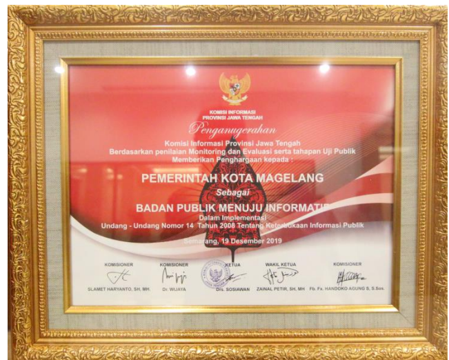
Gambar 3 Penghargaan KIP Award